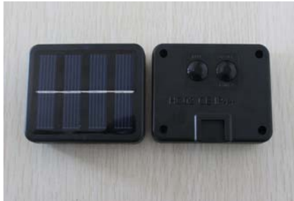
长亮带闪，正反八功能，二路八功能